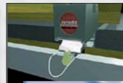
Palettenroller setzt durch Bremsvorrichtung automatisch ab