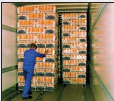
... bei palettierten Waren