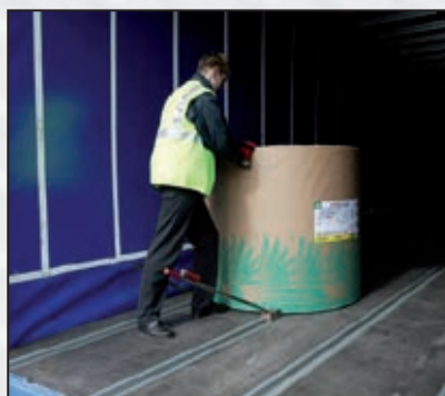
.. zum schonenden Verladen von Papierrollen