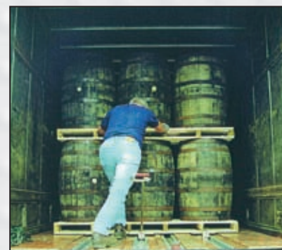
... bei doppelt palettierbarer Ware