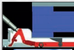
Palettenroller durch Herunterdrücken der Hubstange anheben